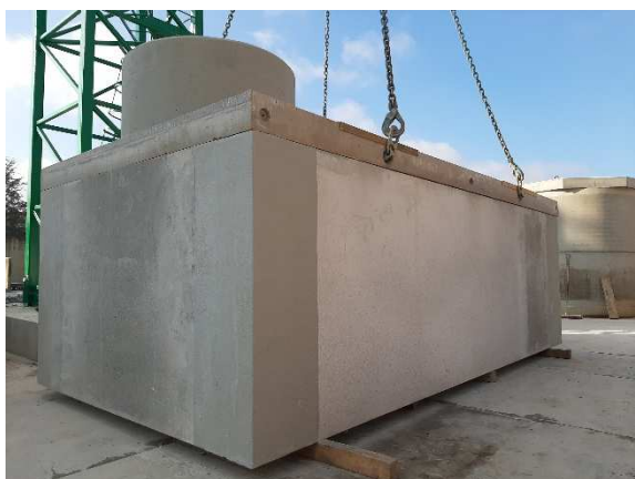
Regard monobloc avec dalle de couverture