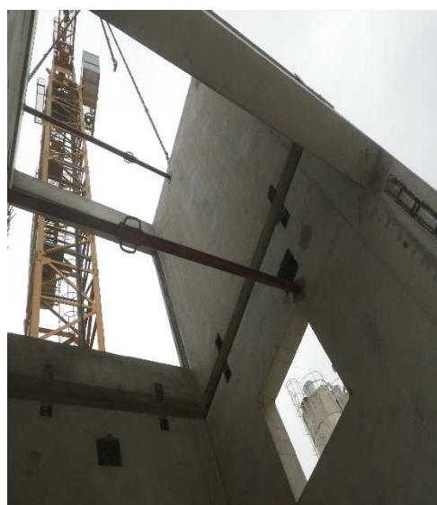
Regard en 2 éléments