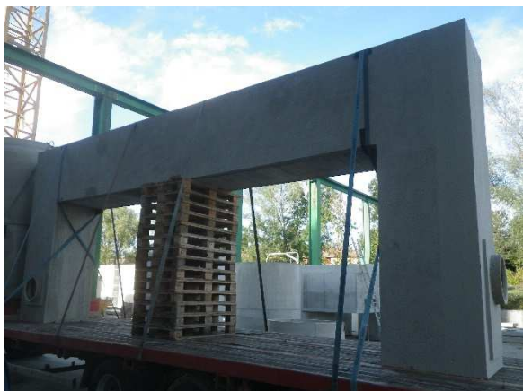
Canal de mesure avec regard amont et aval