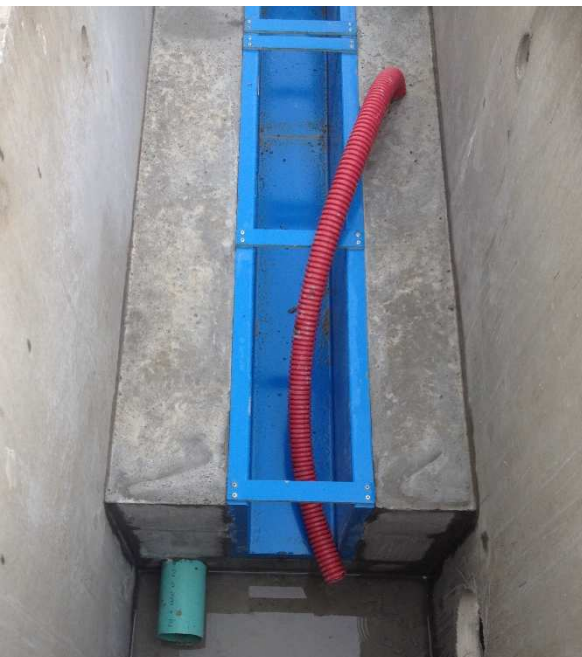
Canal de comptage avec scellement du venturi